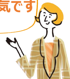
illustration © LIXIL + SHILUSHI. All Rights Reserved.